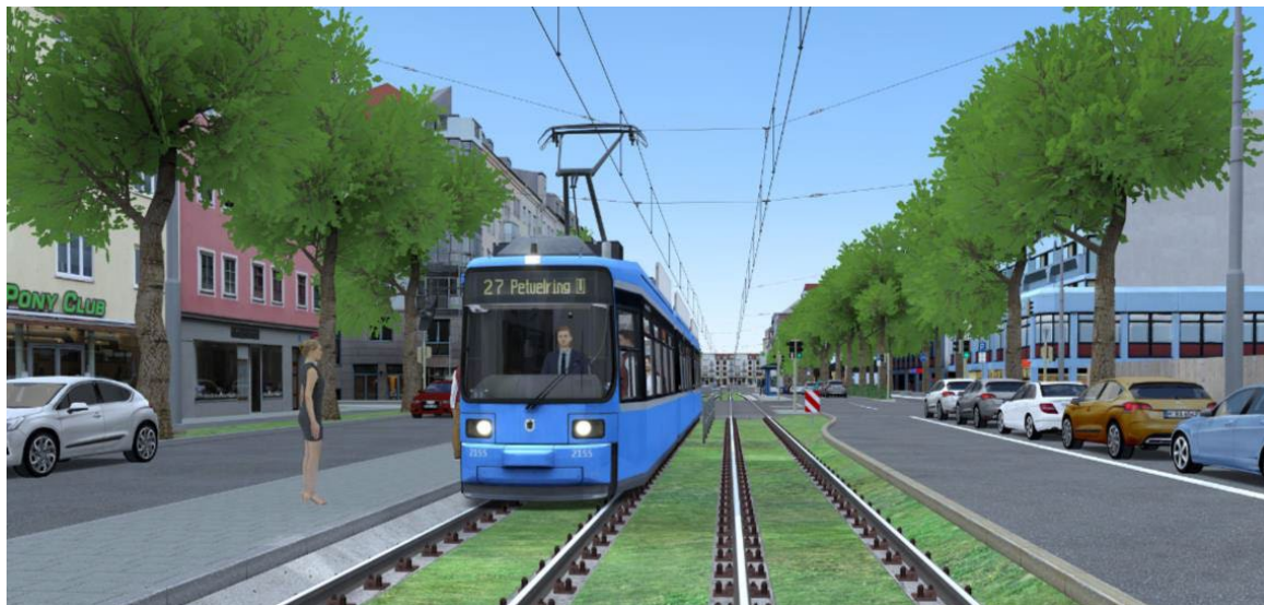
Obrázok 3 Ilustračný obrázok variantného riešenia zatrávnenia a výšky umiestnenia mačiny

lanceolata, Sanguisorba minor a Medicago lupulina 'Ekola' a Trifolium repens. Je nutné sa v projekte vysporiadať s manažmentom údržby tohto priestoru v podobe návrhu druhu a typu zálievky a jej frekvencie. Súčasne je potrebné vhodne nastaviť kosbu tohto priestoru.